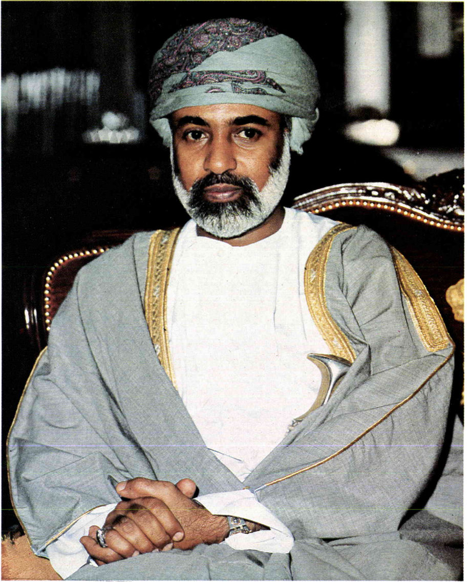
حضرة صاحب السيادة السلطان قابوس بن سعيد المعظم