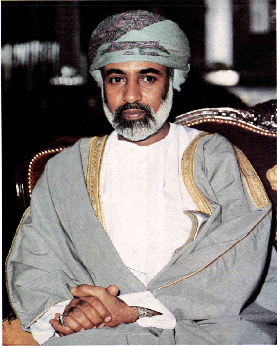
HM Sultan Qaboos bin Said, Sultan of Oman