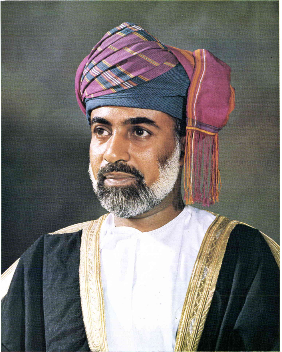
جليلة صاحبته الملكة السلطانة قابو - ابن سعيد المعظم