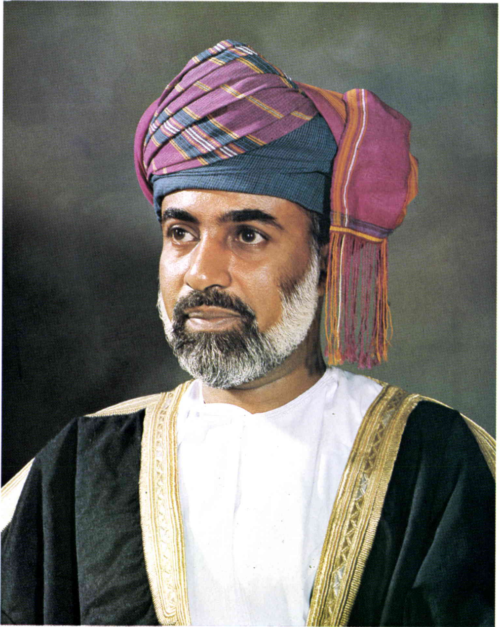
HM Sultan Qaboos bin Said, Sultan of Oman