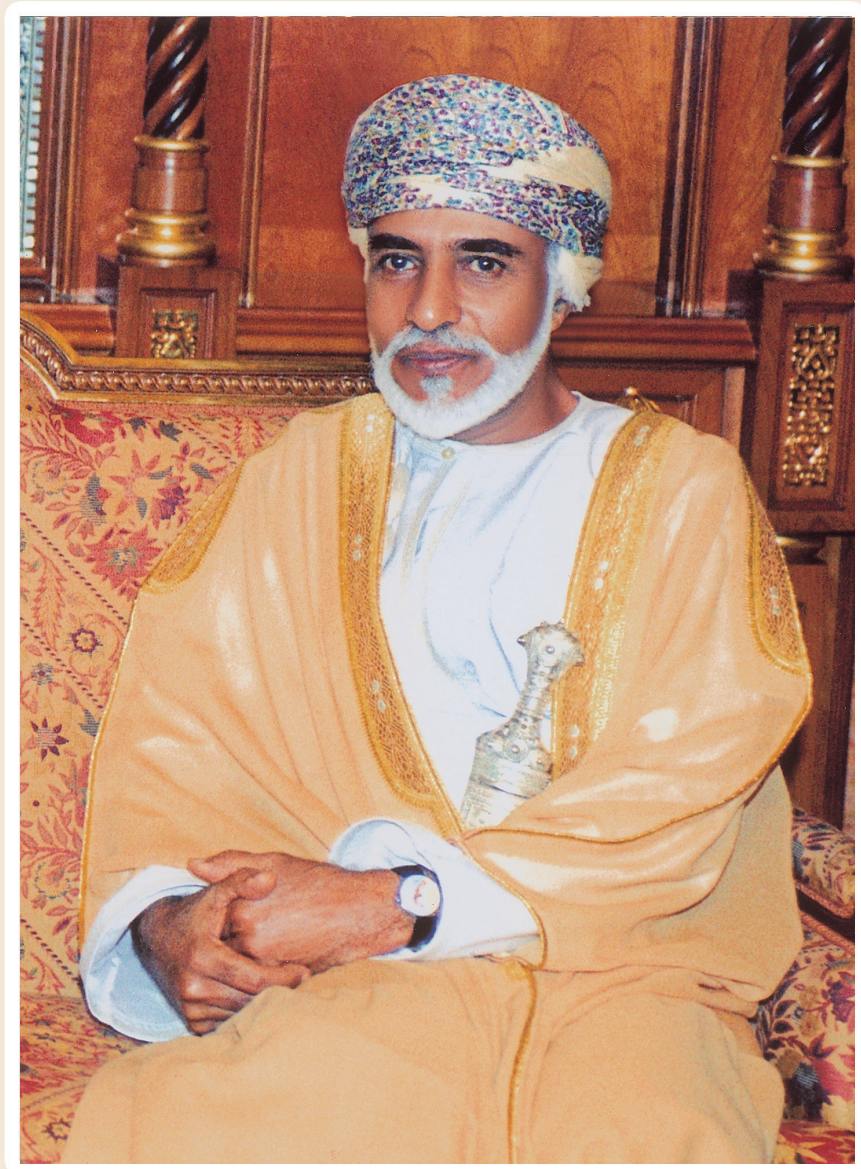
His Majesty Sultan Qaboos Bin Said