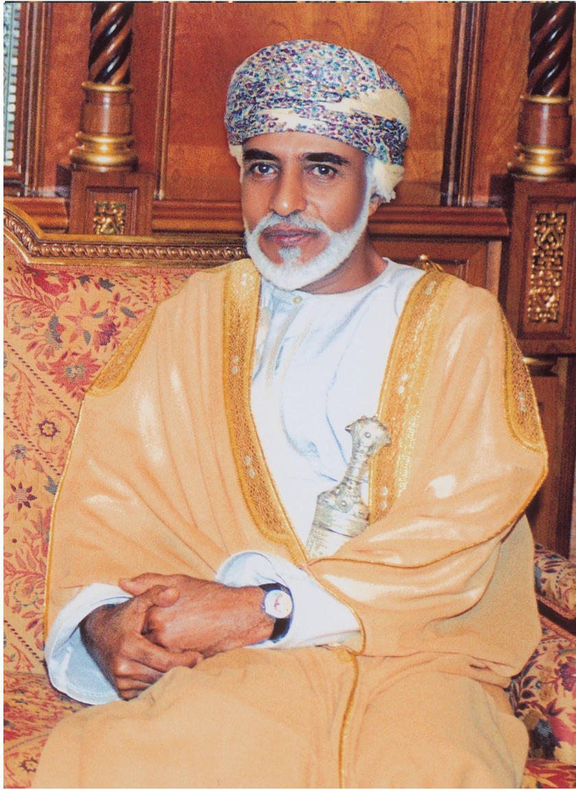
حضرة صاحب الجلالة السلطان قابوس بن سعيد المعظم