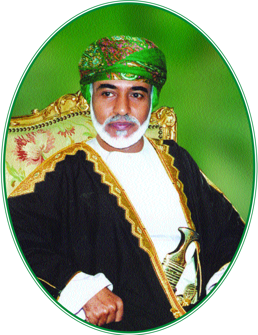
حضرة صاحب الجلالة السلطان قابوس بن سعيد المعظم