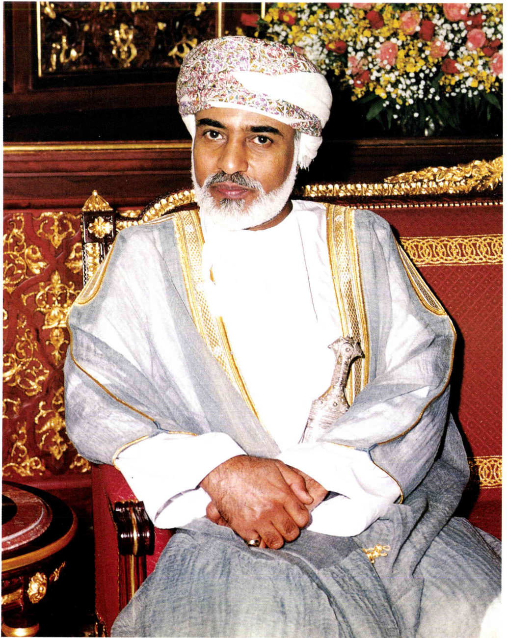
حضرة صاحب الجلالة السلطان قابوس بن سعيد المعظم