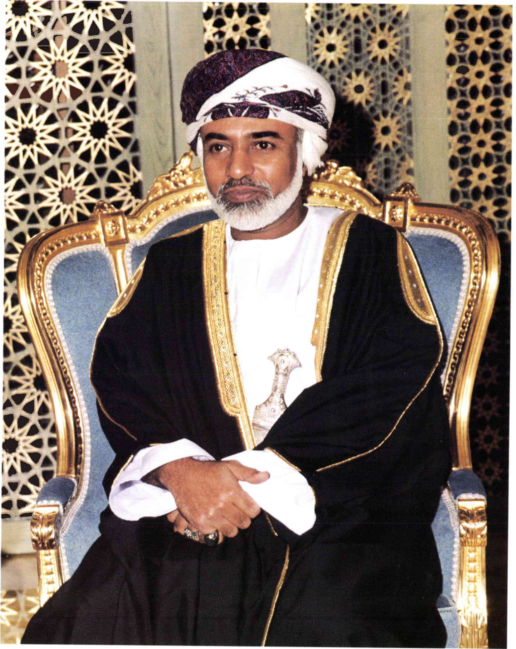
حضرة صاحب الجلالة السلطان قابوس بن سعيد المعظم