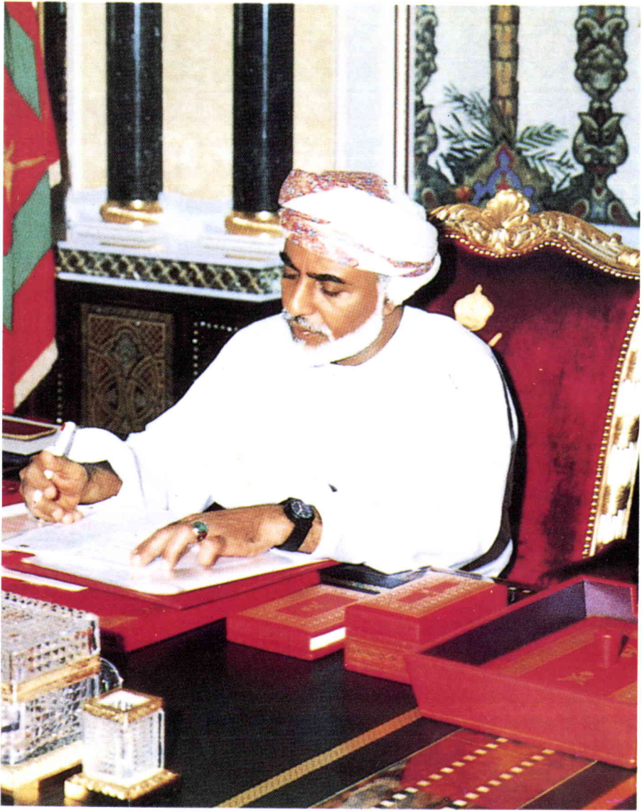
حضرتنا محمد بن زايد آل نهيان السُّلطانُ ابنُ قابوس بن سعيد العظمى