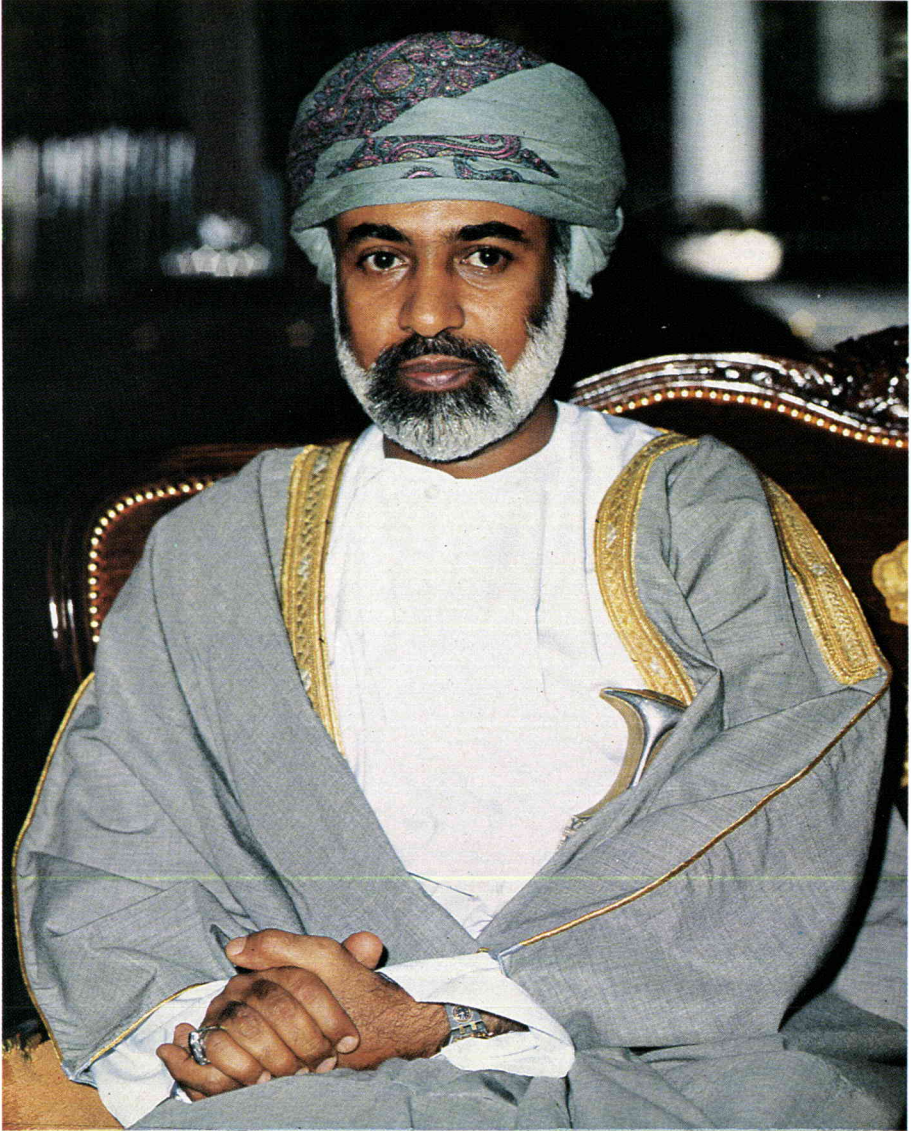
حضرة صاحب السيادة السلطان قابوس بن سعيد المعظم