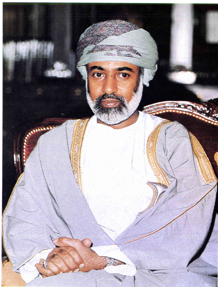
حضرة صاحبزادہ اللہ الشاہ قاری ابن سعید المعظم