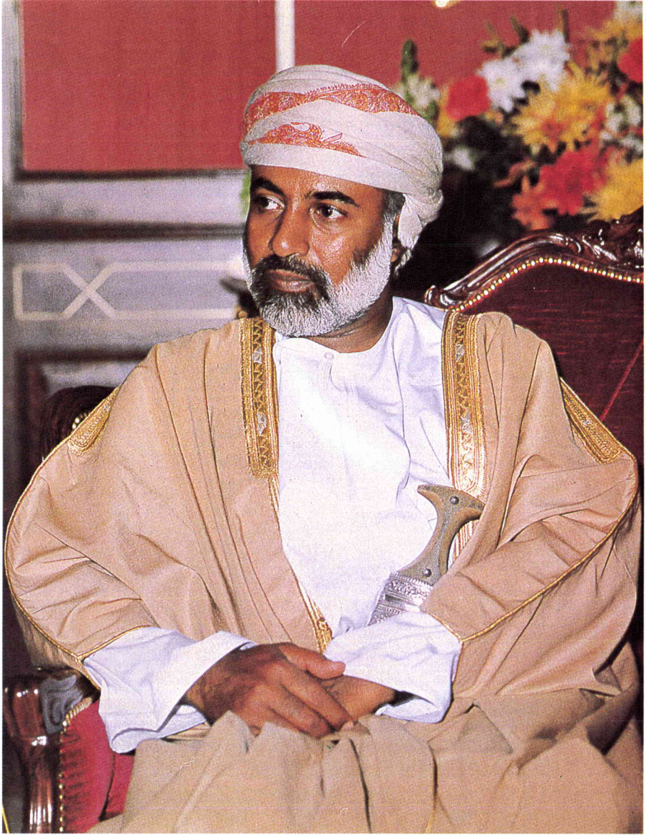
حضرة صاحب الجلالة السلطان قابوس بن سعيد المعظم